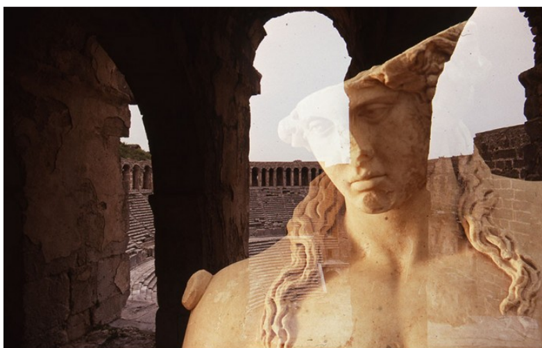
Jedna z fotografií, které budou vystaveny

Skutečný vizuální, veskrze dobrodružný zážitek, který návštěvníka přenesení za hranice běžného pojetí fotografie a dá mu možnost nahlédnout do osobitého světa umělcovy tvorby. Jak se sám mistr vyjádřil: "Toto je v podstatě moje projekce, vnímání života: encyklopedie vizionáře, badatele, historika zaměřeného na tvorbu filosofů, malířů, vědců, kteří celý svůj život zasvětili záhadám vize." Fotografie jeho Římské civilizace jsou kulminujícím bodem projektu, jehož počátky sahají do konce 80.let.